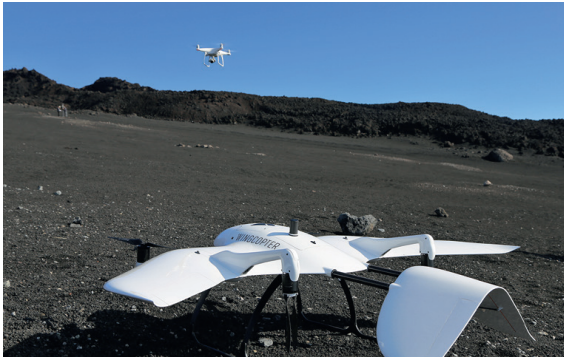
Abb. 1: Bei der abgebildeten Hybrid-Drohne handelt es sich um einen sogenannten Wingcopter, der sich in mehreren GEOMAR-Einsätzen u. a. am Stromboli und Ätna (Italien) bereits bei Kartierung und Krisenmanagement bewährt hat. Im Hintergrund ist eine kleine Kopter-Drohne zu sehen. Dabei handelt es sich um eine DJI Phantom 4 Pro.