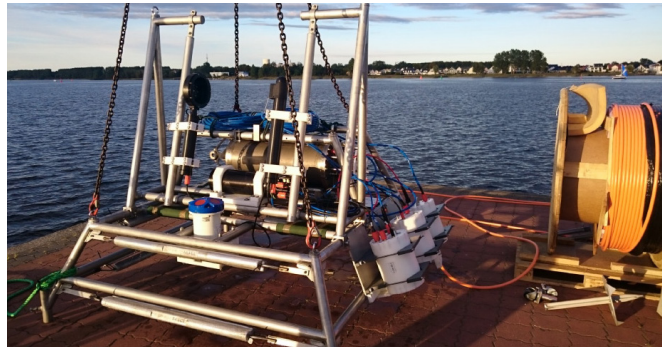
Abb. 4: Das Unterwasser-Plankton Observatorium vor einem Testeinsatz in der Ostsee.

Die kontinuierlichen und zeitlich hochauflösenden Daten des Unterwasser-Plankton-Observatoriums schaffen erstmalig die Möglichkeit, komplette Jahreszeitenverläufe zu beobachten und münden längerfristig in die Etablierung einer Langzeitserie. Diese bieten die Gelegenheit,