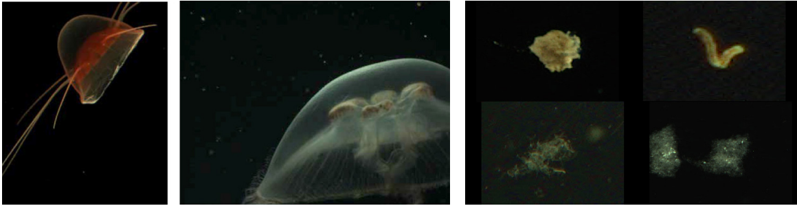
Abb. 2: Beispielbilder eines Video-Plankton-Recorders von zwei Medusen, welche aufgrund ihres gelatinösen Körperbaus in traditionellen Planktonnetzen nicht quantitativ beprobt werden können.