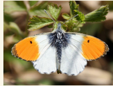
Aurorafalter ( Anthocharis cardamines )